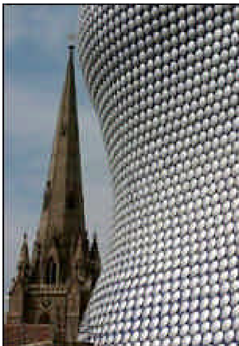
Il Bullring Shopping Centre