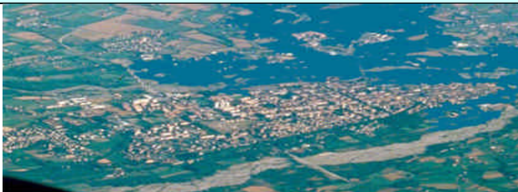
In alto: veduta di Cuneo