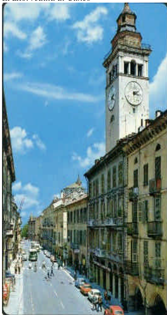
Il centro storico