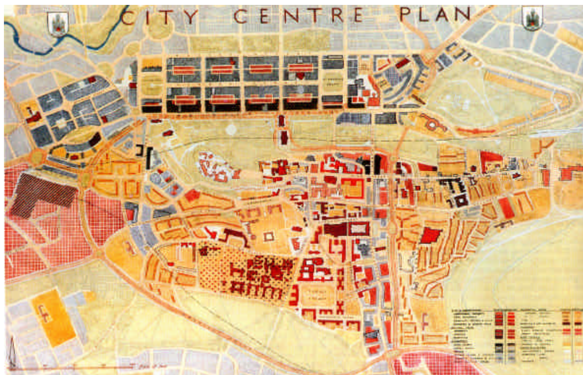
Piano di Edimburgo 1949

green belt economy land supply transport jobs housing