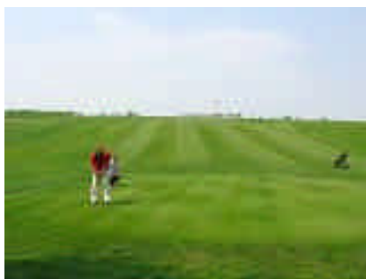
Qualità della vita e attrattività turistica: golf club