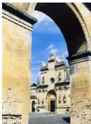
In alto: il centro storico