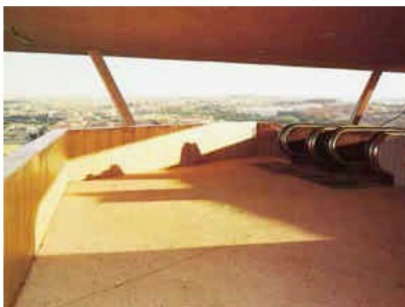
Aspetti del sistema di risalita meccanizzato recentemente inaugurato