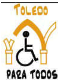
Profilo della città e logo del programma “Toledo para todos”